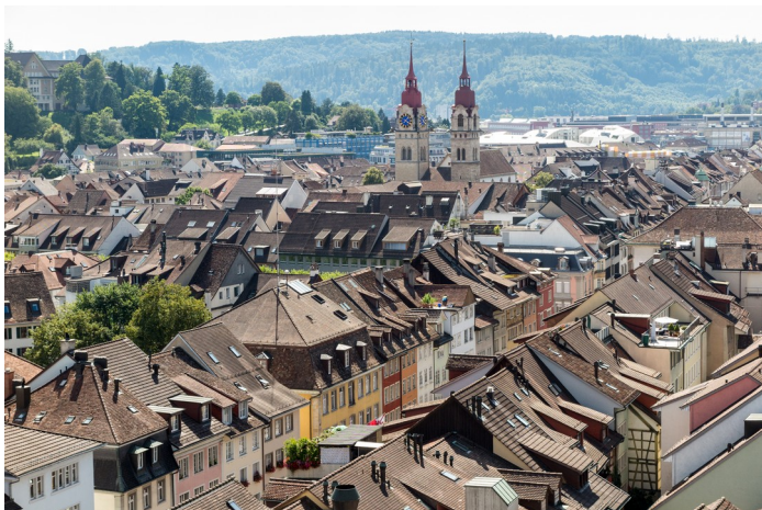
Blick auf die Winterthurer Altstadt